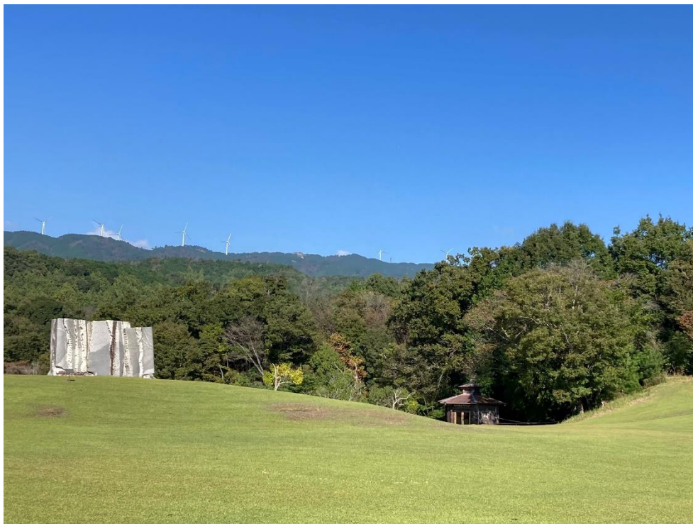
東青山四季のさと