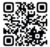
事業計画・ 報告書・議事録