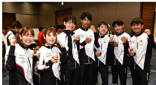
フットオリエンテーリング シニア代表