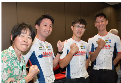
MTBオリエンテーリング