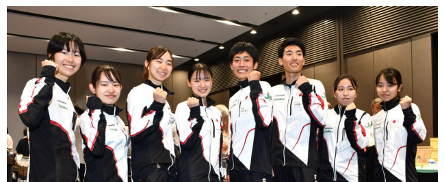
フットオリエンテーリング ジュニア代表