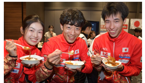
スキーオリエンテーリング